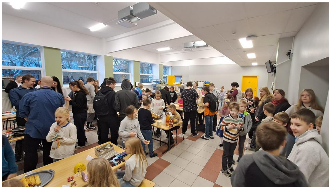
Laadamelu 22. novembril.

5. Soovin koolile veel kaua kestmist! Et koolipere tunneks ennast rohkem kogukonna liikmena ja kogukond saaks rohkem osa kooli tegemistest!