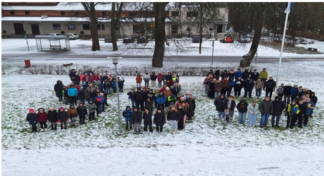
Ühispilet koolimaja ees.