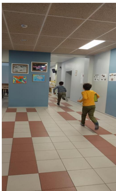
QR-koode otsimas.

Tundides tehti kooli sünnipäevaks kaarte, meisterdati seintele erinevaid kaunistusi ja kirjutati luuletusi.