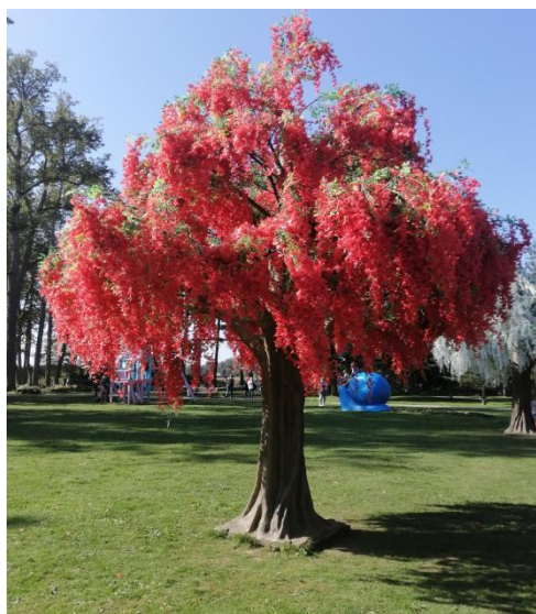
Võlupark „Alice Imedemaal“.