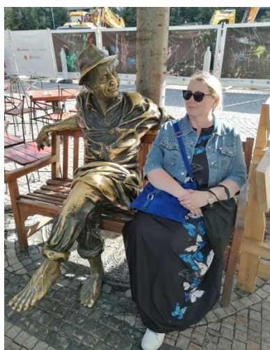
Õp Ilme Prahast.

2. Hea küsimus. Uuel õppeaastal tahaks ka ikkagi toetada ja märgata ning luua õpilaste jaoks sellist mõnusat õpikeskkonda. Ja võibolla hoolitseda sel õppeaastal rohkem selle eest, et ka enda tassid oleksid täidetud.