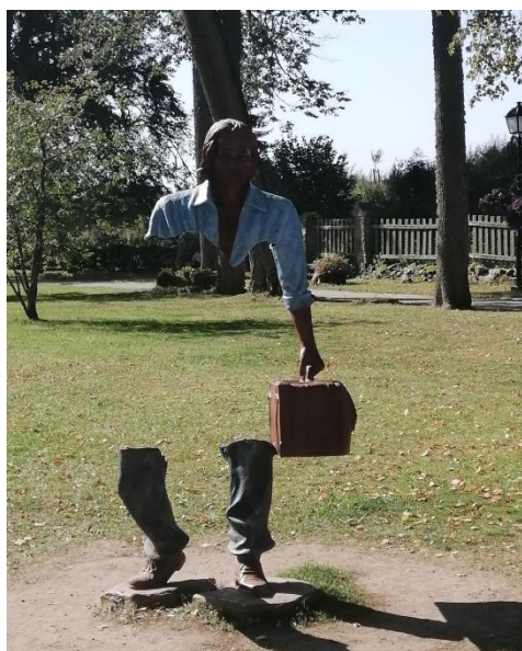
Võlupark „Alice Imedemaal“.