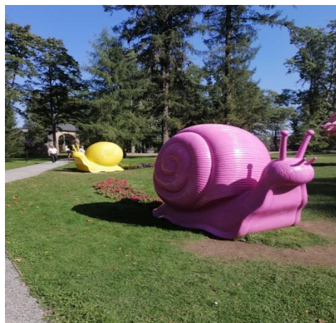
Võlupark „Alice Imedemaal“.