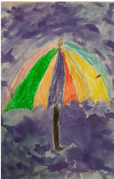
Pildi maalis Genert Inginen